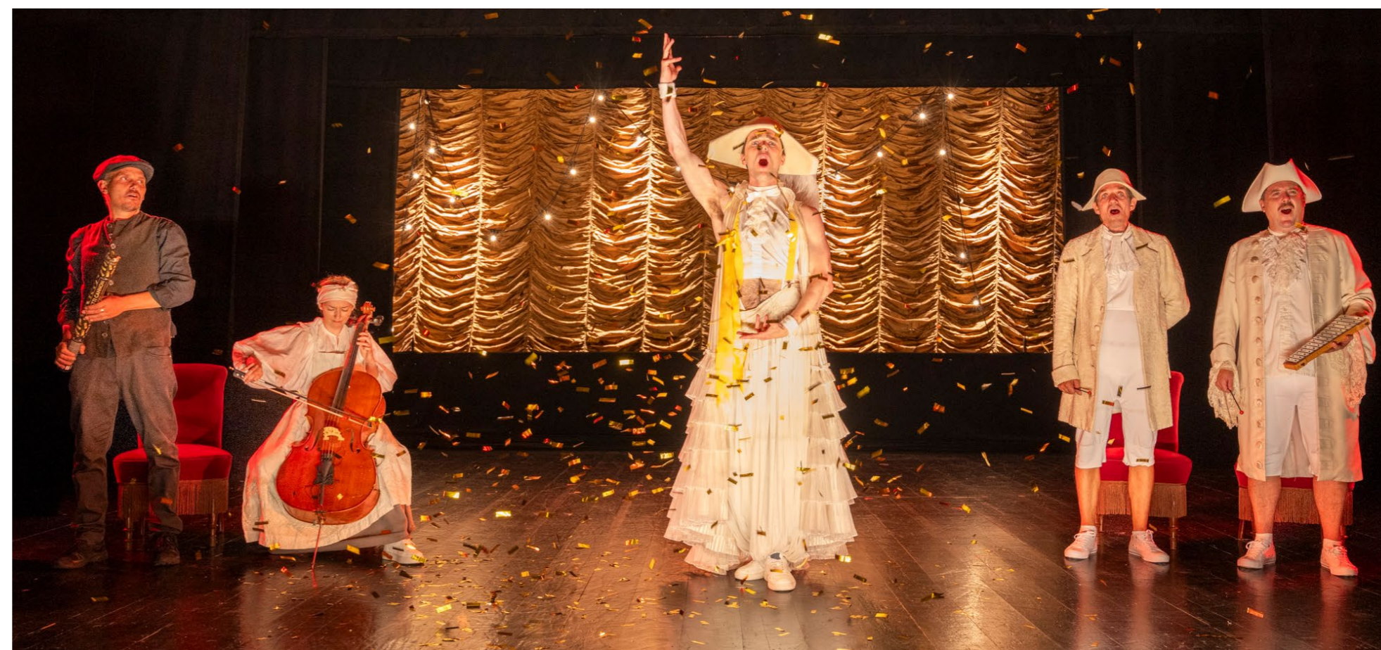
Scene fra 'Tour de Jean de France'

I forbindelse med premieren d. 1. september på denne jubilæumsforestilling var der også fernisering på en udstilling i teaterhaven. Bornholms Teater havde nemlig sammen med Teatermuseet foræret en udstilling over Rønne Theaters historie som jubilæumsgave i anledning af 200-års jubilæet. Udstillingen