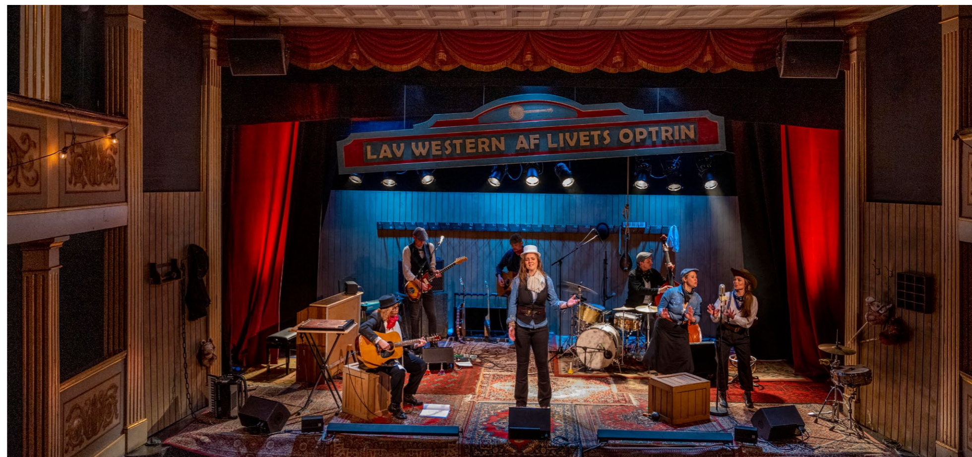
Scene fra '1658 – balladen om Bornholms befrielse' på Rønne Theater

I 2020 foregik koncerten fra scenen på en mobil teatervogn – i 2023 blev dette omdannet til en lignende kulisser, dog på den Gamle Scene på Rønne Theater. Teaterkoncerten gik lige så rent hjem hos publikum i den gamle smukke teatersal, som den gjorde udendørs på mange idylliske lokaliteter tilbage i 2020. Dette på trods af at forestillingen i 2023 blev ramt af sygdom umiddelbart efter premieren, men holdet