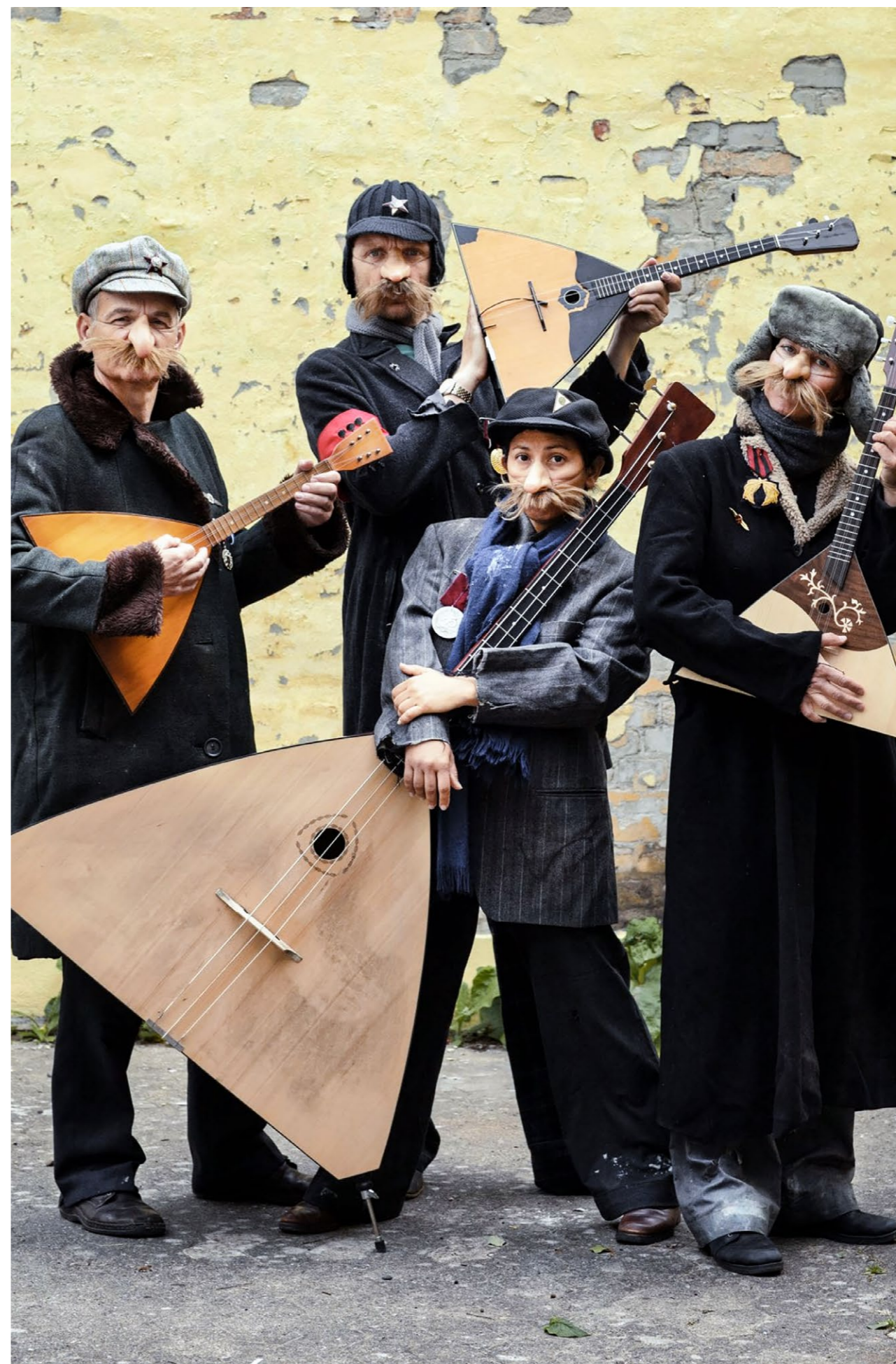
PR-foto for børneteaterforestillingen 'Balalajka'

I forhold til fremtiden er det som følge af de kommunale nedskæringer på den kommende egnsteateraftale p.t. usikkert, om børneteaterordningen kan fortsætte i Bornholms Teaters regi.