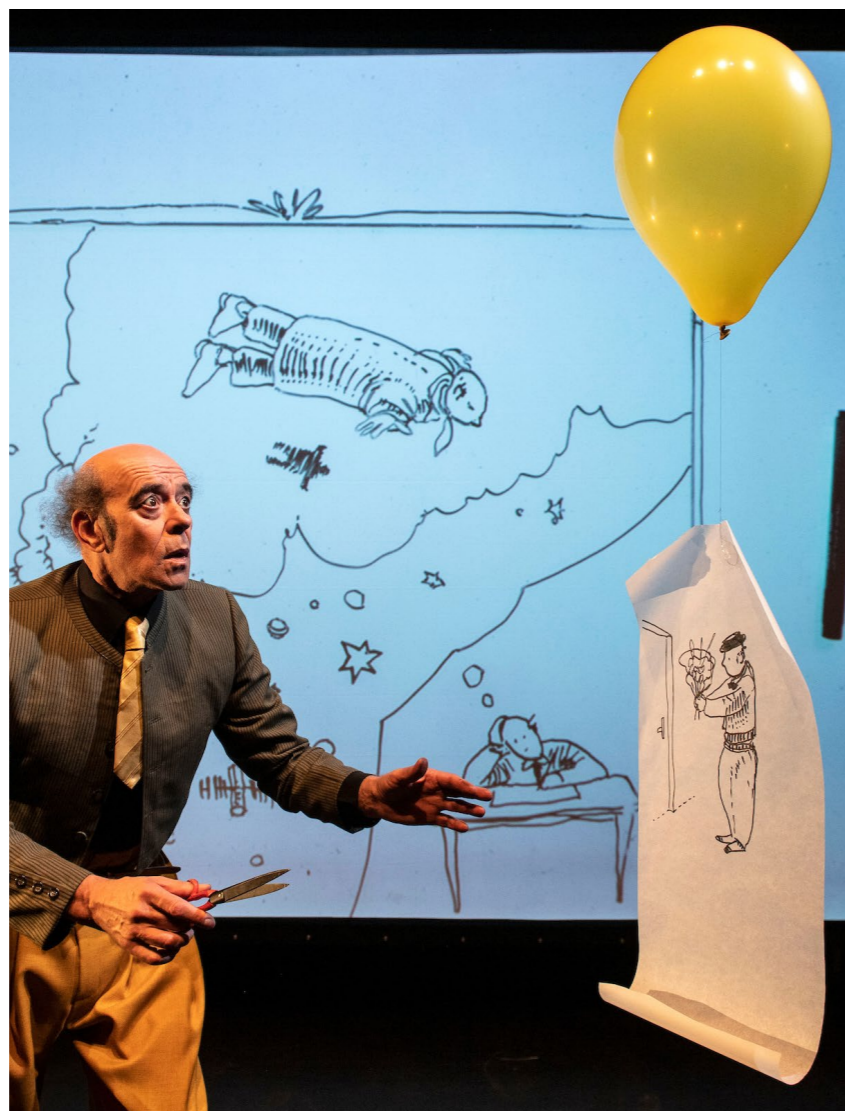
Scene fra gæstespillet 'Livets små mirakler'

Økonomien for denne produktion indbefatter selve produktionen og filmoptagelsen i januar og opførelserne i oktober 2023. Der var ingen billetindtægter, idet publikum kunne tilmelde sig gratis til aftenvisningerne. Til gengæld blev der solgt 6 forestillinger under Børneteaterordningen 2023-24 samt 1 visning under projektet 'Sammen om Scenekunst' - i alt med en indtægt på kr. 25.000. Derudover var der fondsmidler for 230.000 og brug af statslige udviklingsmidler på kr. 50.000; samlet var der indtægter for kr. 305.000. Der var udgifter for kr. 226.890, hvorved det endelige resultat for Pelle-produktionen blev på et overskud på kr. 78.110.