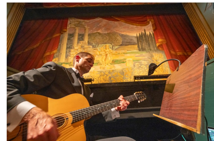
Scene fra 'Tour de Jean de France'

Med en egenkapital på kr. 715.438 pr. 31.12. 2022 og årets resultat på kr. -421.443, er egenkapitalen pr. 31.12. 2023 nu på kr. 293.995.