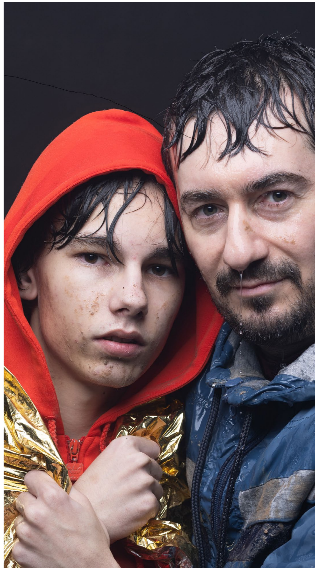
Scene fra '1. kapitel – en nutidig dialog med Pelle Erobreren'

Tredje fase bliver en visning af filmen som selvstændigt værk, hvilket er under udvikling