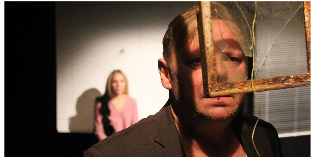
Scene fra gæstespillet 'Kære far'

'Postyrium' blev stillet gratis til rådighed for Bornholm imod, at lokale institutioner og BRK tog sig af den lokale planlægning og lokale omkostninger i forbindelse med placeringen af 'Postyrium' og markedsføring af samme. Oprindeligt var det Kulturskolen, der havde påtaget sig rollen som lokal koordinator, men i forbindelse med et lederskifte på kulturskolen tilbød Bornholms Teater at overtage denne rolle. Øvrige samarbejdspartnere var Musikhuzet, Kulturskolen og Kulturugen. Bemandingen af 'Postyrium' stod Det Kgl. Teater for.