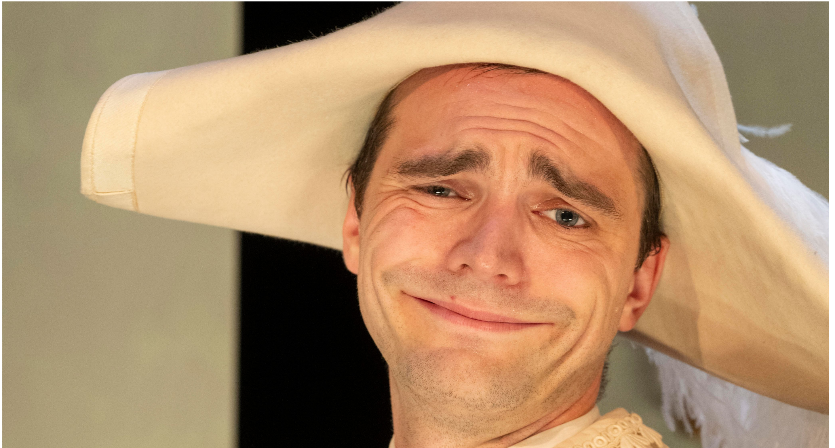
Scene fra 'Tour de Jean de France'