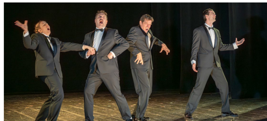
Scene fra 1. akt i 'Tour de Jean de France'

sæsonkortet) og ydet et tilskud fra Turnénetværket på kr. 38.750; dermed samlede indtægter på kr. 46.134. Der var i alt udgifter for kr. 120.096, hvoraf kr. 93.730 gik til køb af gæstespil. Et endeligt resultat på kr. -73.962.