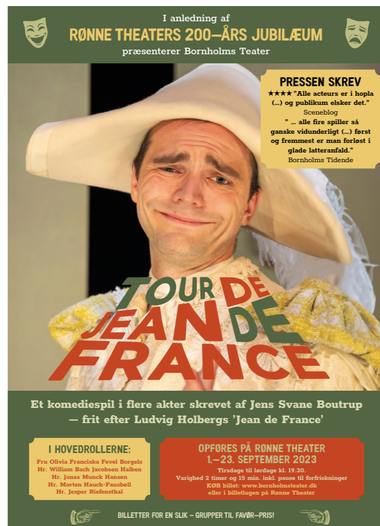
Plakat til 'Tour de Jean de France' (design: Frank Eriksen)