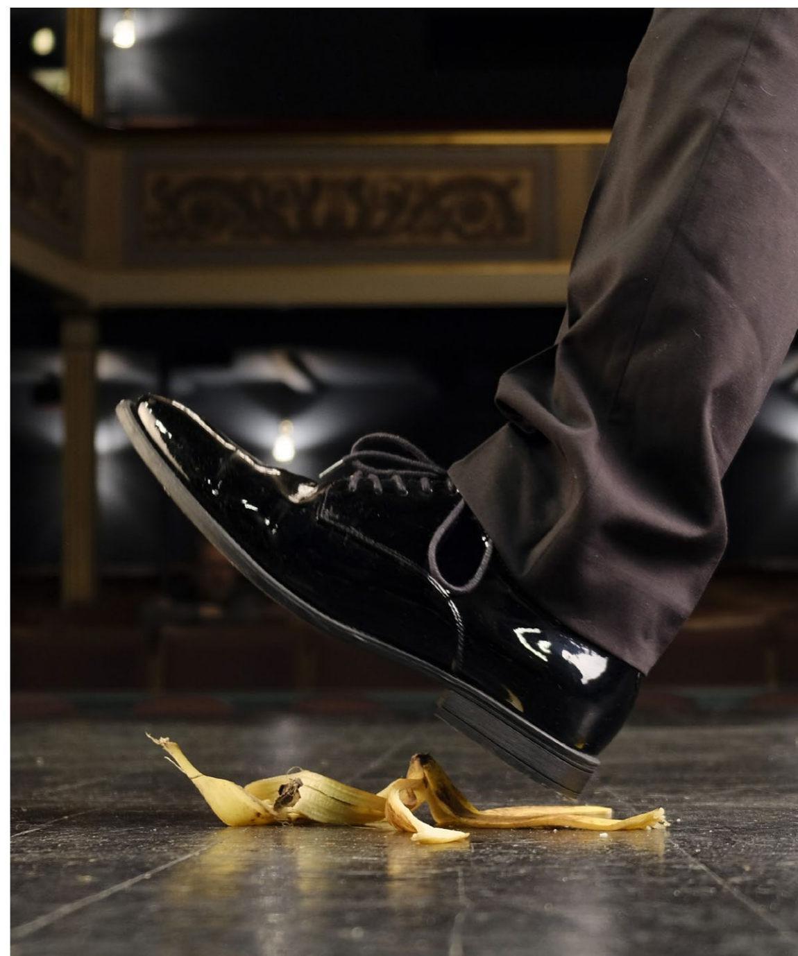
Plakatfoto for 'Buster'

Der skal også arbejdes på en rebranding af Bornholms Teater – herunder udvikling af en ny hjemmeside og nyt logo.